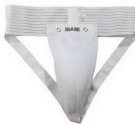
4. Защита на пах.